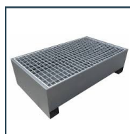
Bac de rétention