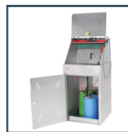
Nettoyeur de pistolets